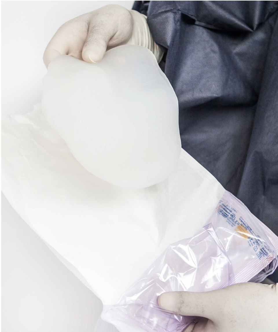
Medical-grade silicone elastomer sterile implant

Se advierte a los cirujanos sobre el riesgo de hematoma inducido por el uso de un drenaje de succión. El fuerte gradiente de depresión entre los dos planos lisos (tórax e implante) puede aspirar el coágulo de coagulación de las grandes arterias perforantes y provocar un sangrado temprano.