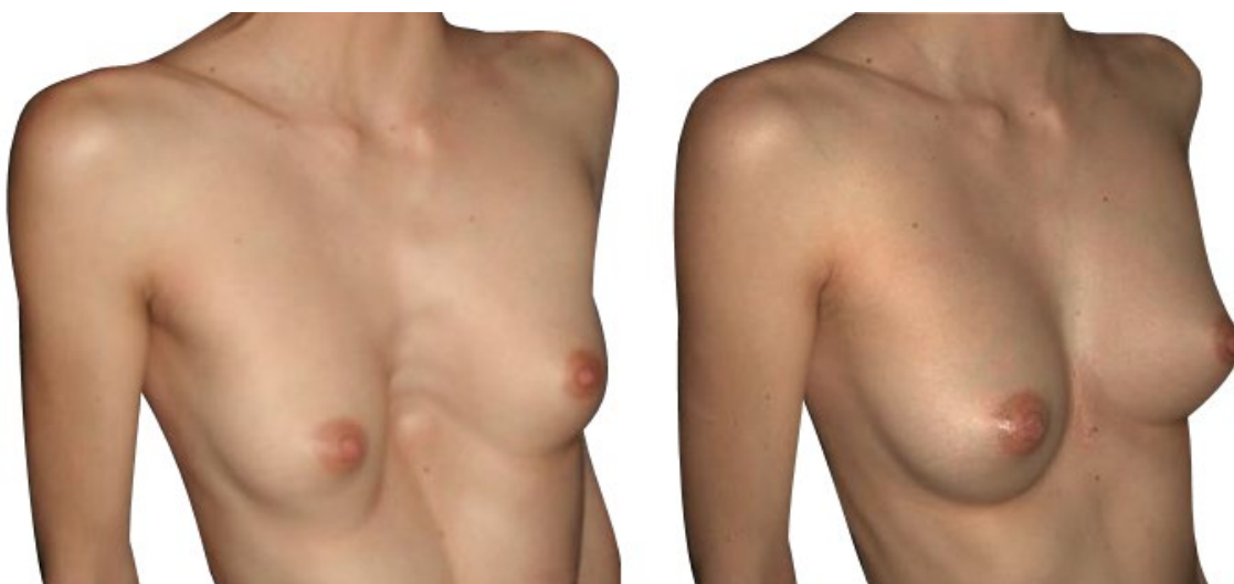
Antes / después de la cirugía en una mujer