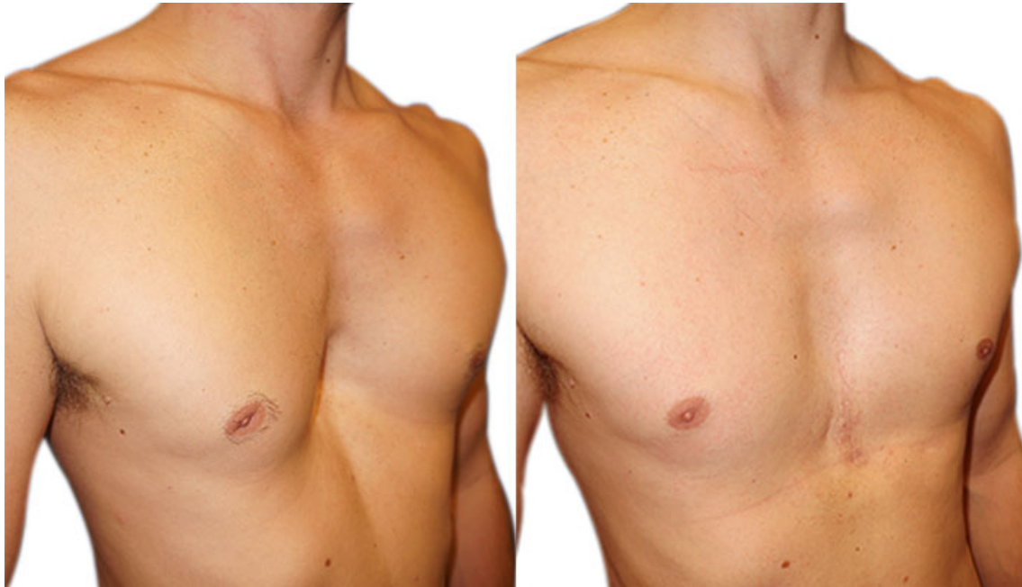
Antes / después de la cirugía en un hombre

Las técnicas modernas de reconstrucción asistida por ordenador han mejorado aún más los resultados estéticos, especialmente en las formas muy profundas y/o asimétricas, especialmente en las mujeres. La corrección de la deformación es en la gran mayoría de los casos, total, definitiva y natural, con una restauración anatómica muy satisfactoria.